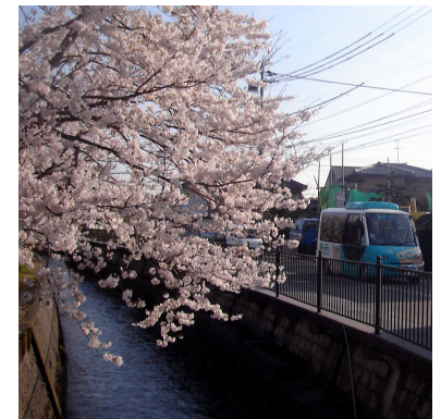
青のっティと桜(本町1丁目付近)